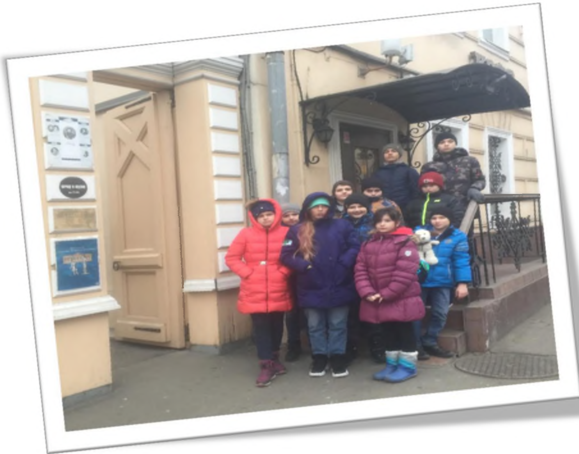
Наша «Первая Школа» на экскурсии в доме-музее В.Л. Пушкина дяди Александра Пушкина, где он любил бывать.